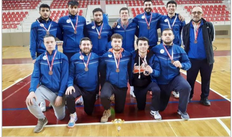
Çorum KYK takımı üçüncülük maçında Eskişehir'i yenerek üçüncülük kupasının sahibi oldu.

Cumartesi günü Eskişehir ile bu kez üçüncü-